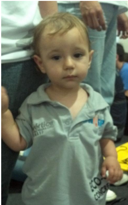
Mascote dos concursos