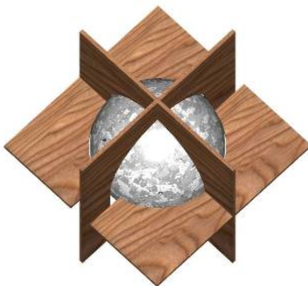
FIGURA 1 – Planos ortogonais para determinação das dimensões da bola

Dúvidas e esclarecimentos poderão ser encaminhadas ao fórum do Comitê de Atividades Estudantis – CONCREBOL (SITE DO IBRACON) por meio de mensagem à coordenadora Eng a Janaína Araújo ou pelo email concrebol@ibracon.org.br .