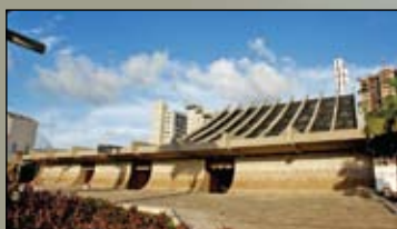
Recuperação da Catedral Metropolitana de Natal