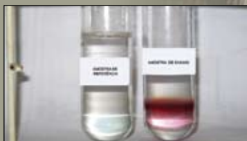
ABNT NBR 15900 - Água de amassamento do concreto