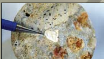
Caracterização de RAA em testemunhos de concreto